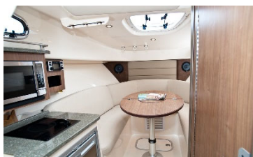
キャビン ダイニングテーブル(可動式)使用時