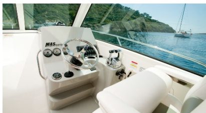
ステアリングシステム