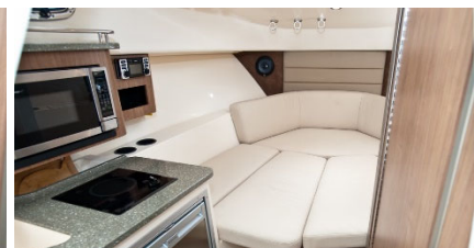
キャビン クッションシート使用時