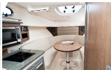
キャビン ダイニングテーブル(可動式)使用時