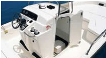
センターコンソール

※ パウレールをサイドレールに変更できますが、その場合パウレールは取外しになります。 ※ リパシブルヘルムシートはベデスタルシート2基に変更できます。