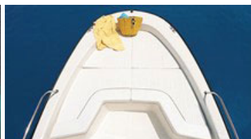
パウクッション (オプション)