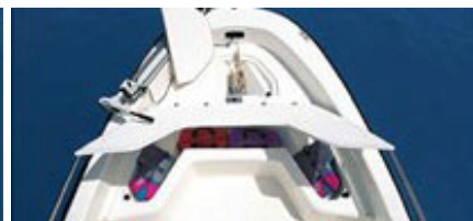
パウアンカーロッカー