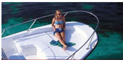
コンフォートパッケージ