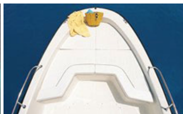
パウクッション (オプション)