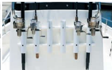
ロッドホルダー (オプション)