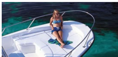
コンフォートパッケージ (オプション)